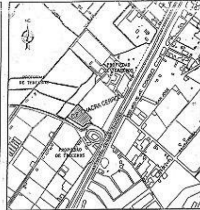
PLANO DE UBICACION ESCALA 1:100.000